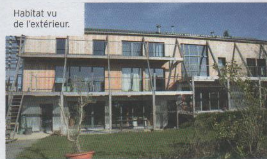
Habitat vu de l'extérieur.