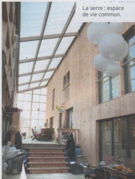
La serre : espace de vie commun.